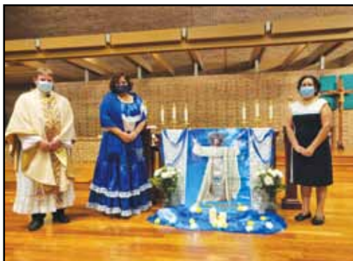
agosto 2020: Celebración de Jesucristo, Rey del Universo