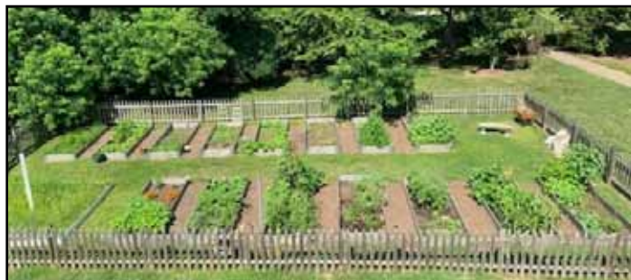
verano 2020: el grupo de Padres ha cultivado la huerta de vegetales y donar a los necesitados.