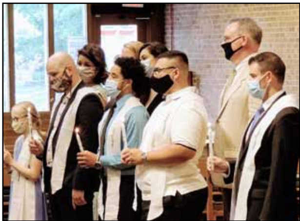
junio 2020: reiniciamos la vida parroquial! Sacramentos de Iniciación de la Pascua pasada.