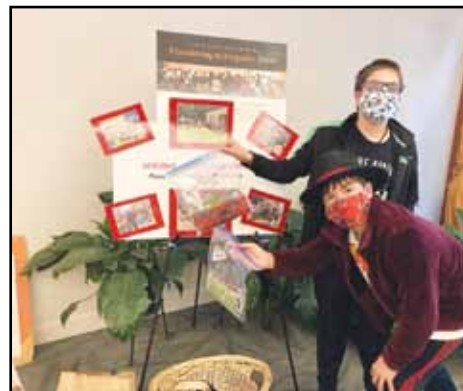
los adolescentes hicieron mascarillas para donar a los refugios parte del proyecto de verano.