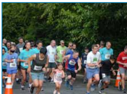
La carrera 5K y de 1 milla fue un gran éxito, y trajo a muchos corredores a beneficio de obras de caridad!