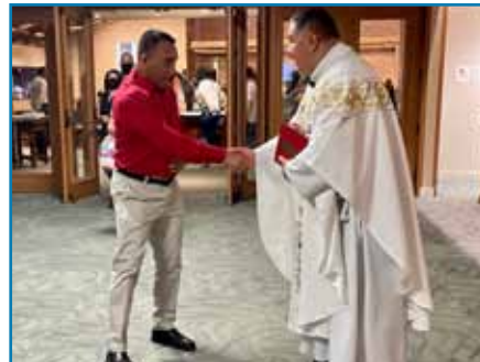
Misa diaria en español ahora de lunes a viernes, 7pm