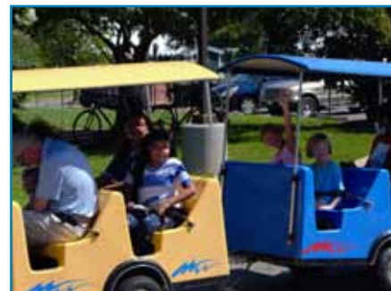
¡El Festival Internacional ha regresado en persona y nuevamente por tres días!