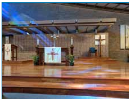
Adoración al Santísimo dos veces por día (de lunes a viernes)