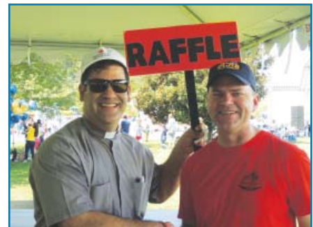
El Kiosco de la Rifa

Nuestra parroquia es muy bendecida con los feligreses que enriquecen la vida parroquial en la liturgia, convivio y servicio. ¡Muchas gracias por su participación!