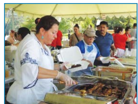
Pupusas, carne asada...and more in the Hispanic booth!