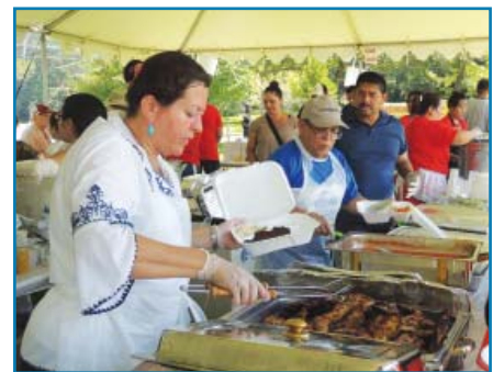
Pupusas, carne asada...y mucho más en el Kiosco Hispano