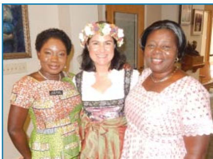
La Misa Multicultural reúne a diversas culturas