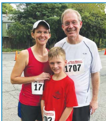
Part of the Ferguson clan running in the 5K race and 1M fun run