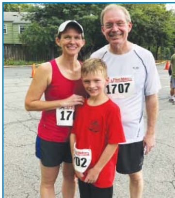
Miembros de los Fergusons en la carrera 5K y caminata de 1M