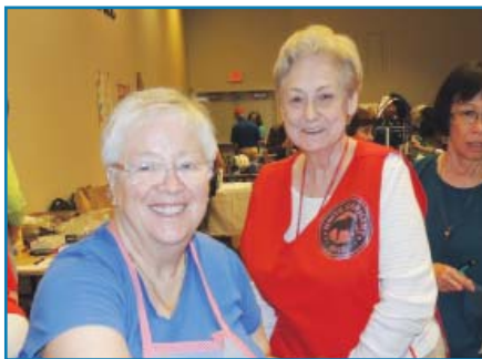
Our Yard Sale is the biggest in Alexandria!