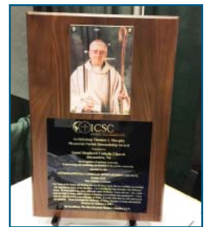
Premio Thomas J. Murphy