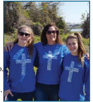
Limpieza del Río