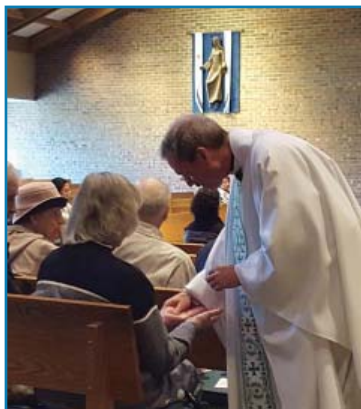
"Señor, ten misericordia de nosotros" - Sal 33 Misa con la Unción de los Enfermos en marzo