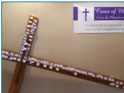
Oraciones en la Cruz de la Misericordia en Cuaresma