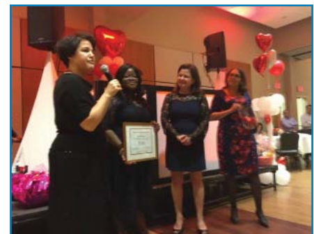
Cena y Baile de San Valentín