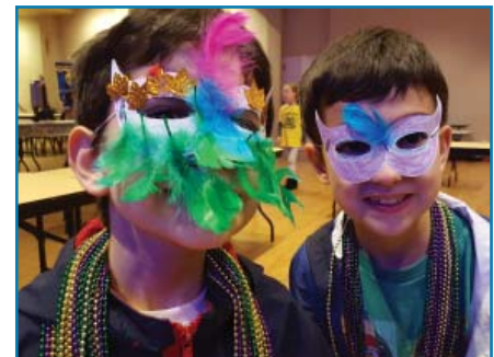
Celebración de Mardi Gras

Somos bendicidos con feligreses que enriquecen la vida de nuestra parroquia en la liturgia, convivio y el servicio. ¡Gracias por su participación!