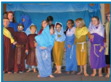
Camino a la Cruz, Estudiantes K-6