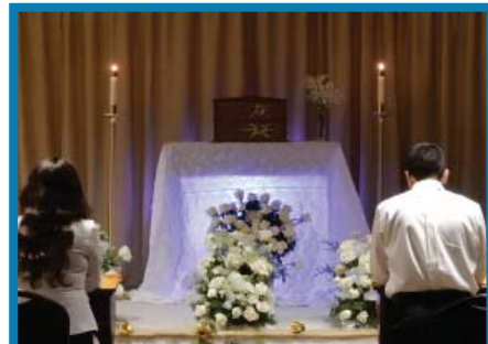
Adoración al Santísimo Sacramento - Jueves Santo