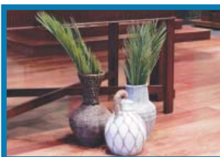
Domingo de Ramos