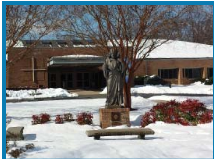
La Nevada del 2016