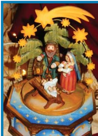
Muestra de Pesebres