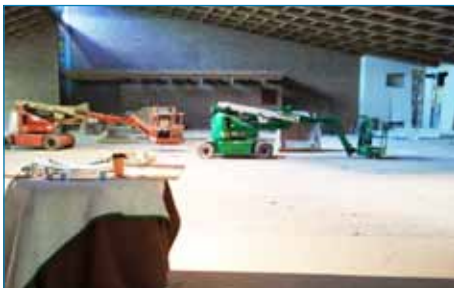
El Templo - Antes y Después